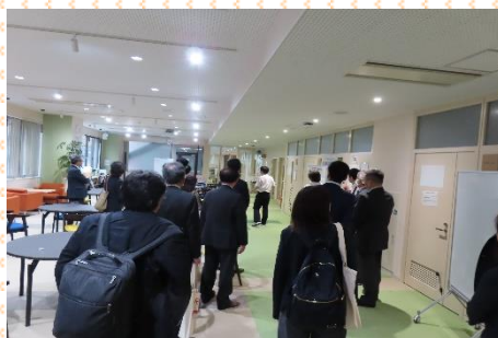
学校視察（授業・施設見学）