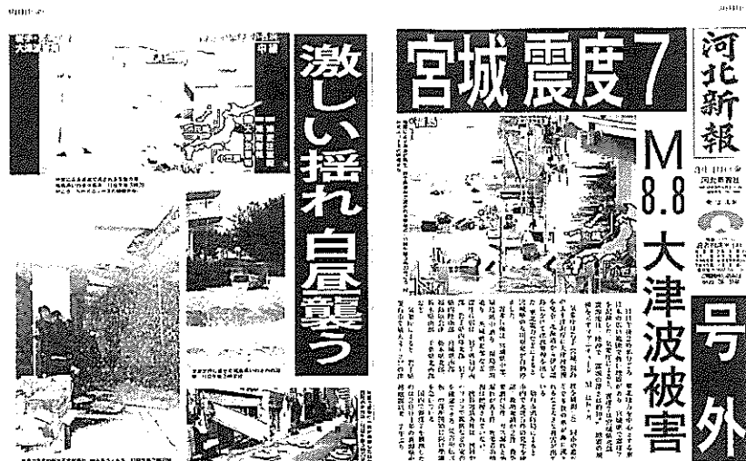
当日の河北新報号外