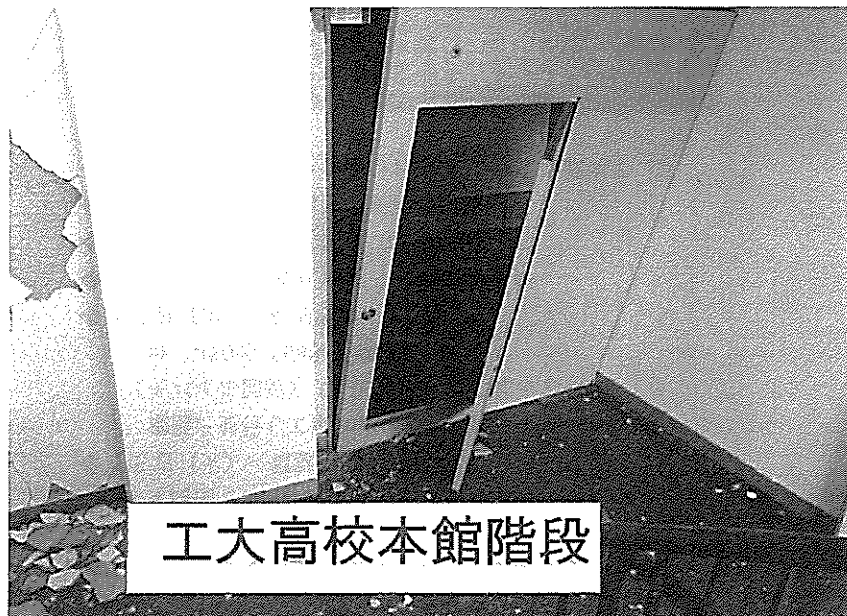
工大高校本館階段