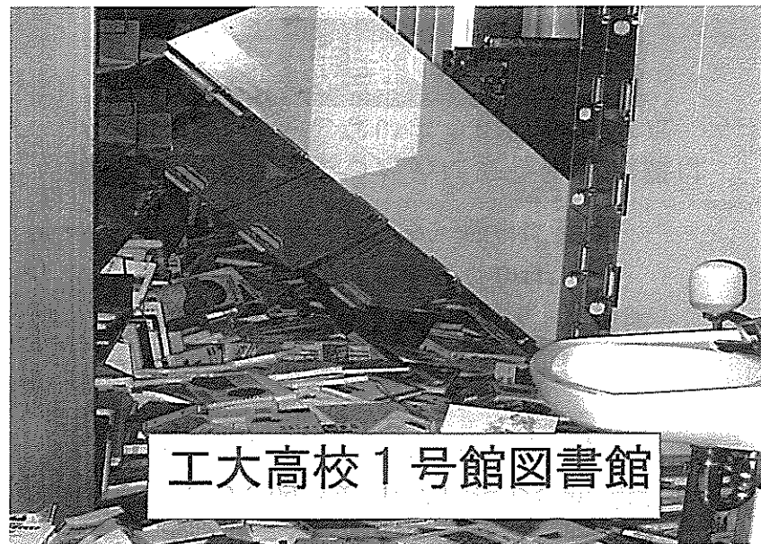
工大高校1号館図書館