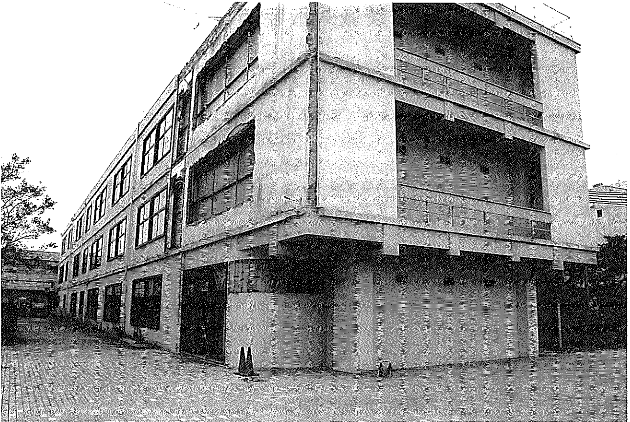
水戸女子高等学校 旧校舎

日頃の信頼関係が大切である」そして「校長としては先を見ながら、行動しなくてはならない」と言っていたことと並んで印象的だった。