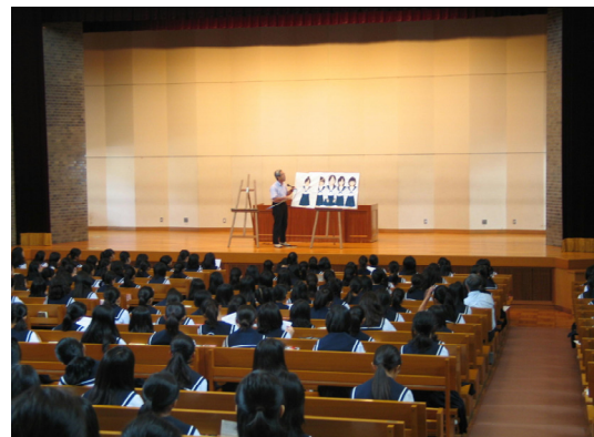
「私とあなたの関係を考える」ワークショップ9/1

教育相談室では常勤のスクールカウンセラー（臨床心理士）による相談体制ができあがっている。その他に相談室担当教諭・養護教諭の連携でこころと身体の両方の支援が続いている。基本的に学校での治療的カウンセリングは行わず、必要な場合には専門機関へコンサルテーションしている。また医療機関に繋がった場合には学校は主治医の治療方針に従い、その為に担当者が医療機関に赴くことは多い。身体の健康の場合も同様である。このように他の医療機関や相談機関