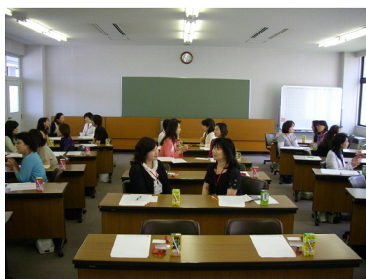
「親学のワークショップ」二人組でロールプレイ

第2回目（11月11日）は同じテーマでPM理論による親のリーダーシップの発揮をテーマにしたワークショップで、20名の参加者があった。この2回のワークショップを通して、真の「子どものため」とは「親自身が豊かに生きること」だと気づかれる参加者は多い。