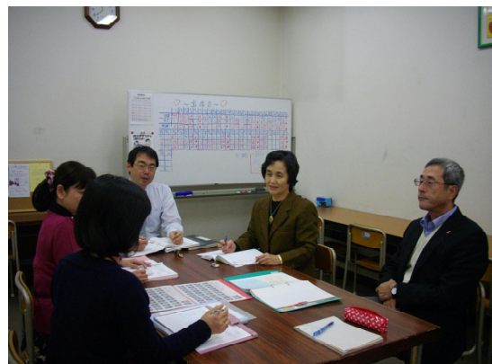
ケース会議は週に1度開催される 右端が筆者

なおケース会議は中高が合同で行われるために、メンバーは教頭・相談室担当教諭(筆者)・常勤のスクールカウンセラー(臨床心理士)・専任の養護教諭・高校のスクールソーシャルワーカー、高校の専任のスクールソーシャルワーカー(社会福祉士・精神衛生福祉士：社会科の教員兼務)の計5名である。